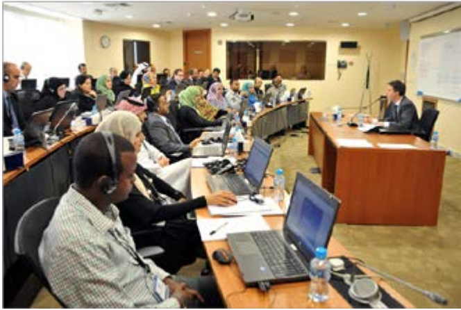
المشاركون أثناء المحاضرة

الإصلاحات المثمرة، كما قمنا بتخفيض تكاليف الإنتاج، وإصلاح النظام الضريبي، وتعزيز السياسات الاجتماعية، وتوفير المزيد من التمويل للجامعات».