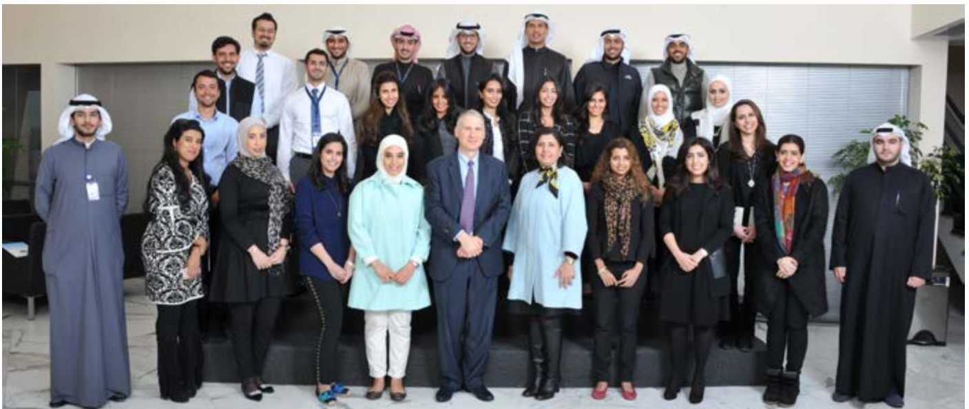
صورة جماعية للمشاركين

وشارك المركز في هذه المبادرة الهامة، كجزء من أهداف المركز الخاصة بتعزيز العلاقات مع المؤسسات الكويتية الرائدة، من خلال استضافة ٢٠ مشاركاً، في ٤ فبراير ٢٠١٦، كجزء من برنامج المهنيين الشباب (YPP). وخلال الدورة