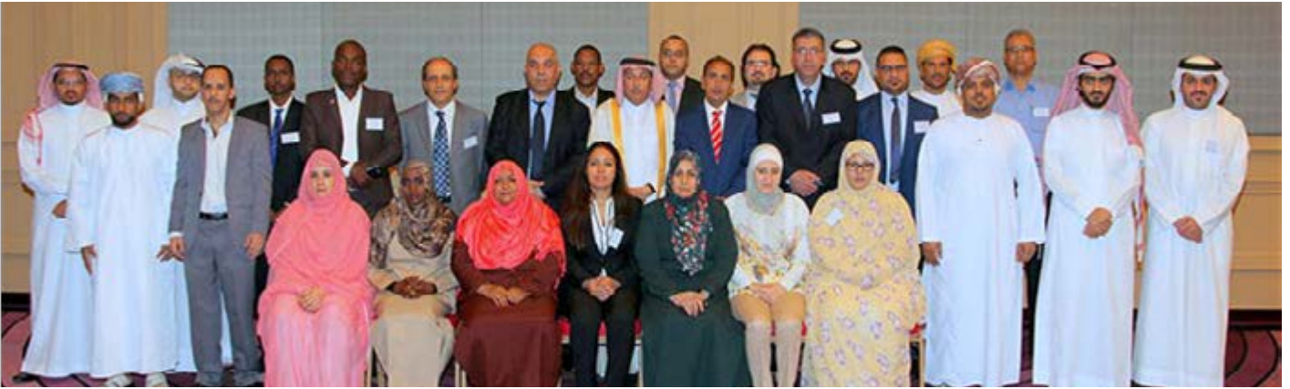
مشاركين في البرنامج التدريبي

مقططات من البرامج التدريبية، الدوحة (قطر)، ٢٨ شباط/فبراير – ١٠ آذار/مارس، ٢٠١٦