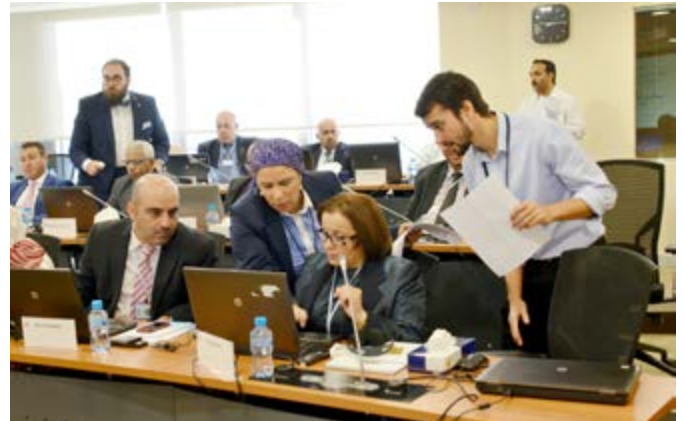
مشاركين في الندوة التعريفية

عقد المركز في ١ آذار/ مارس ٢٠١٦ الندوة التعريفية الثالثة لمدراء إدارات التدريب لتقييم الاحتياجات التدريبية المتغيرة، وتبادل الآراء بشأن الأولويات على صعيد السياسات المعتمدة لدى بلدان جامعة الدول العربية. وشارك في الندوة ٣٠