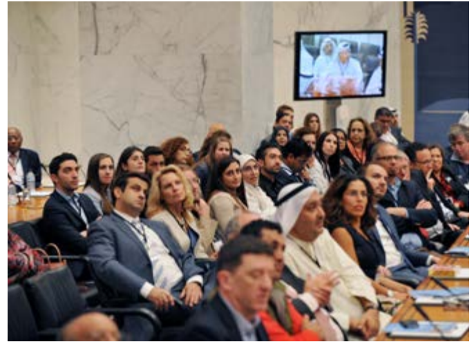
مشاركون في الحلقة النقاشية

وأضاف فريدمان «أن إزالة الحواجز أمام التجارة عبر الحدود والتدفق الحر للأفكار يسمح بتنمية القطاع الخاص ومساعدة الدول العربية على النمو عالميا إضافة إلى تنويع قاعدتها الإنتاجية»، واسترسل قائلا «ان هذا بالغ الأهمية خاصة بالنسبة للبلدان المنتجة للنفط التي تعتمد على مصدر واحد للإيرادات». وأشار فريدمان إلى أنه في الوقت الذي رفعت فيه بلدان شرق آسيا وغيرها من الاقتصادات الصاعدة إنتاجها بمعدل نمو مرتفع ومستدام وعززت قدرتها التنافسية في السوق العالمية، كان التقدم الذي أحرز في معظم البلدان