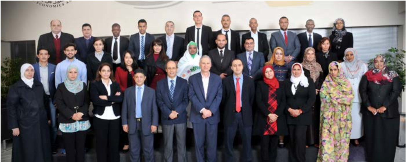
مشاركين في البرنامج التدريبي

مقتطفات من البرامج التدريبية، الكويت، ٧-١٨ شباط/ فبراير ٢٠١٦